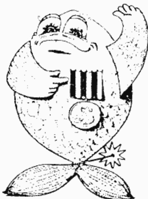
Illustration av en fisk som vinner Svenska simkåren i samband med vattensportens 50-årsjubileum

Kommittén har långt framskridna planer på att starta vattengymnastik till musik under sakkunnig ledning. Slutligen finnes vissa intressenter för polo i mer eller mindre professionell klass. Intresserad ledare lär finnas, men som vanligt är det problem med badtider.