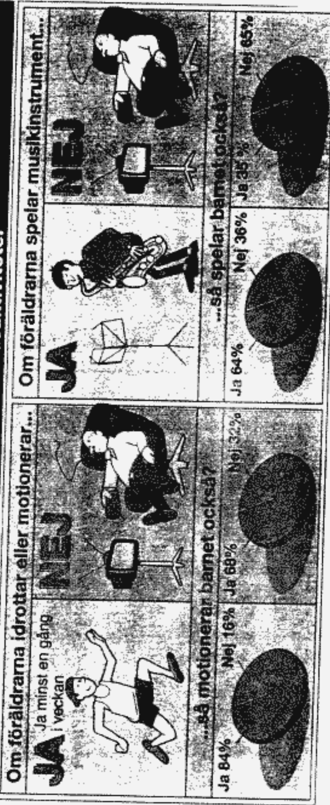
Illustration: MARTIN EP