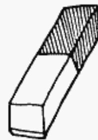
En rättelse i föregående STÄNK NR 2