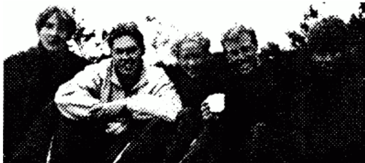
Gästade simmare inför SM i sommar från Laxen, Halmstad