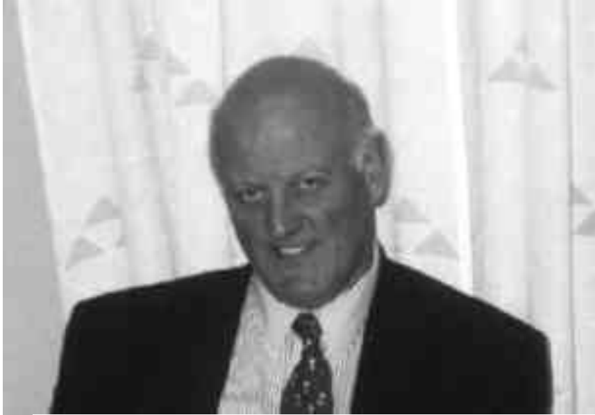
Författare till denna artikel: Börje Jacobsson

Sitter här som vanl... framför brasan!!! Nåja, nu är det aprilvädret som bestämt att man tänt en brasa i öppna spisen!! Utanför fönstret snö/regnar det och man undrar om våren är på "G"!