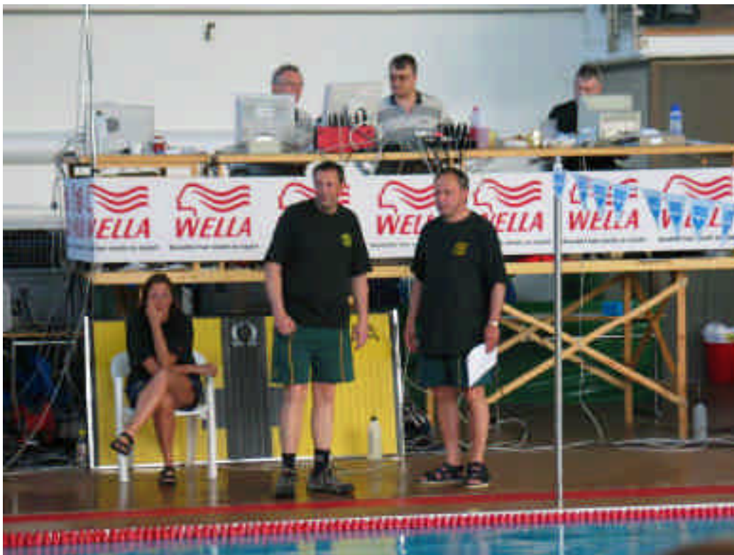
Podiet, starter, tävlingsledare