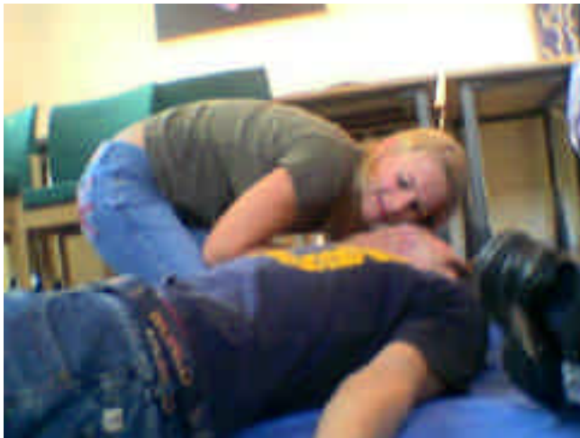
Calle M och Rebecca E

mare som håll på att simma in till sin tävling Svea Cup som skulle avgöras lite senare.