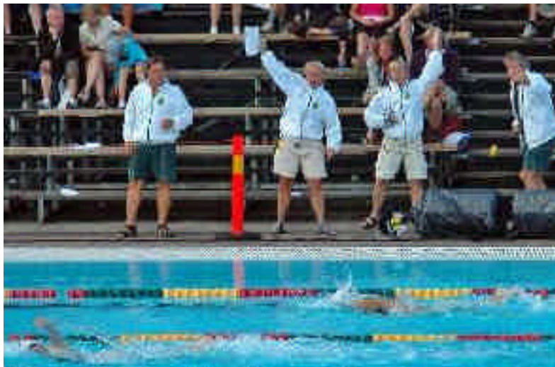
Täby Sims lagkappstjejer hejas fram av Täby Sims engagerade tränare!