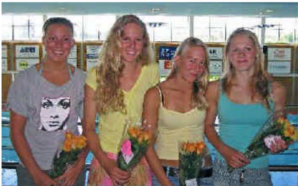
Täby Sims SM & JSM-medaljörer sommaren 2005 (från vänster till höger):