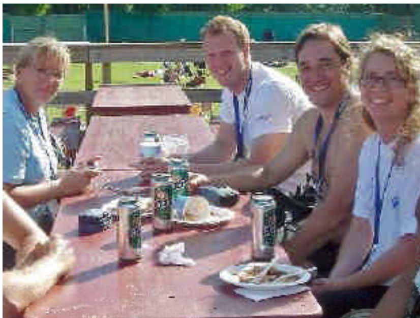
God stämning vid lunch under Masters-EM. Några av Täby Sims masterssimmare tillsammans med Täby Simmare som hjälpte till som funktionärer m.m..

Tre timmar som tidtagare, med trista långsamma simningar... trodde jag! Mina farhågor kom raskt på skam. De ansvariga funktionärens från den Europeiska simorganisationen LEN klargjorde att tävlingarna skulle avgöras med fart och fläkt och visst blev det så. När sista man var i mål blåstes det snabbt upp till nästa heat. Ibland blåstes det till och med lite väl snabbt, då det visade sig att någon ihärdig dam eller herre hade 10-20 m kvar att simma i heatet!